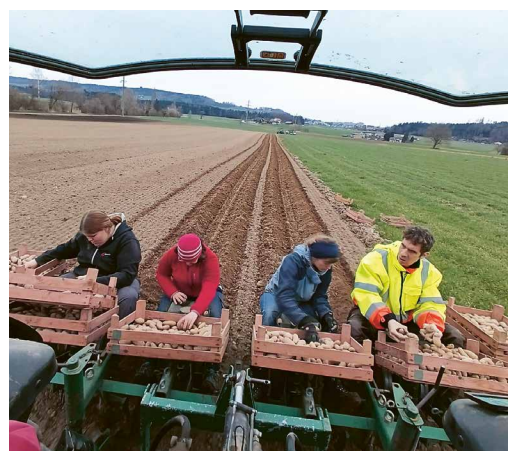
Beim Kartoffel setzen.

Neben den spannenden beruflichen Perspektiven wird sich auch für uns als Familie ab Sommer 2026 ein ganz neues Feld öffnen. Per Ende Schuljahr werden wir, meine Frau und unsere vier Kinder, in das Bauernhaus auf dem Hof Brunnmatt einziehen können. Es freut uns sehr, dass wir unseren Arbeitsort bald schon auch unseren Lebensort nennen dürfen. Somit haben wir als Familie eine langfristige Perspektive erhalten und können uns auf viele interessante Jahre freuen.