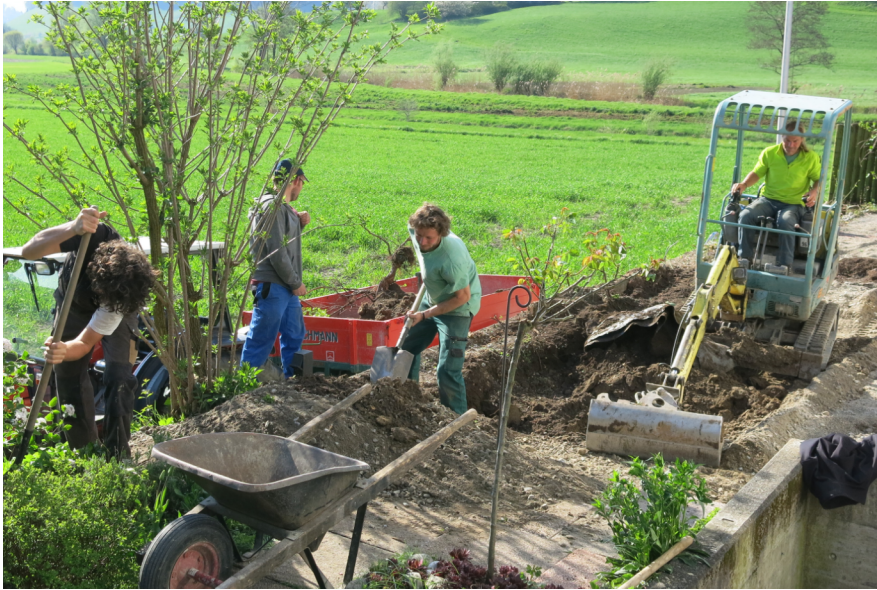
L'atelier Paysagisme en train de construire un biotope chez un client.