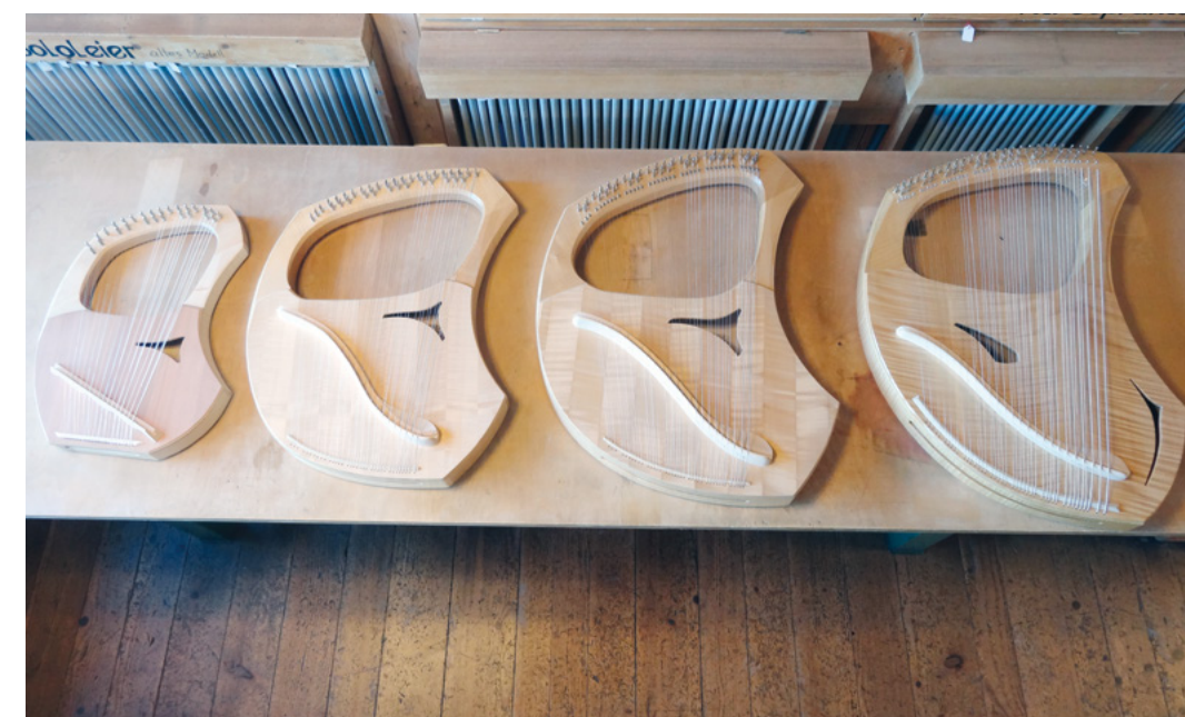
Von links nach rechts: Soprani, Sonora, Solista, Alto