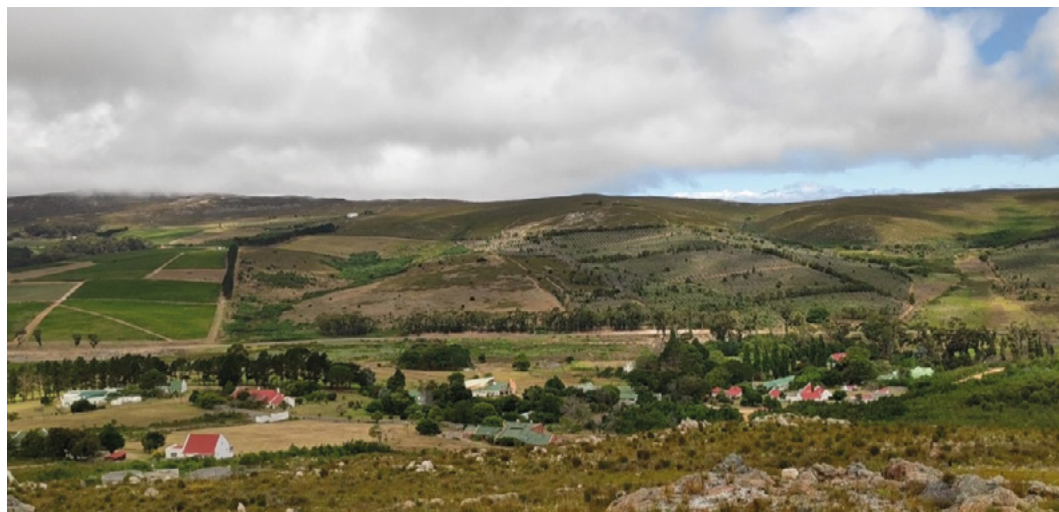
Gelände Camphill Hermanus.

Sie erklärten mir, wie es hier im Camphill abläuft. Einiges kam mir bekannt vor, ist doch vieles ähnlich wie bei uns im Humanushaus: die Werkstätten, die Morgenfeier, Eurythmie, Musizieren, Tischgebet, der Kräutergarten, der Hof, die Sonntagsfeier und vieles mehr.