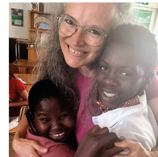
Die herzliche Verabschiedung von den Schülerinnen und Schülern.