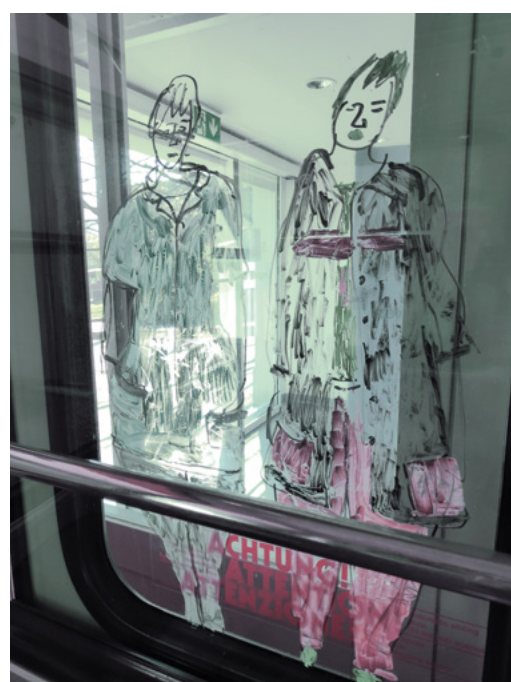
Kunst am Marzilibähnli.