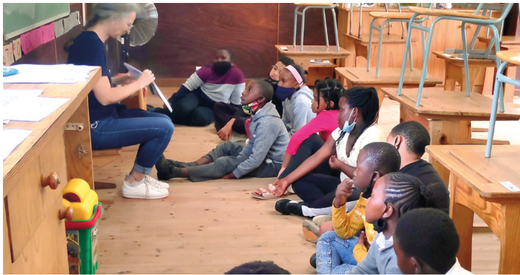
Beim erzählen von «Schellen Ursli».