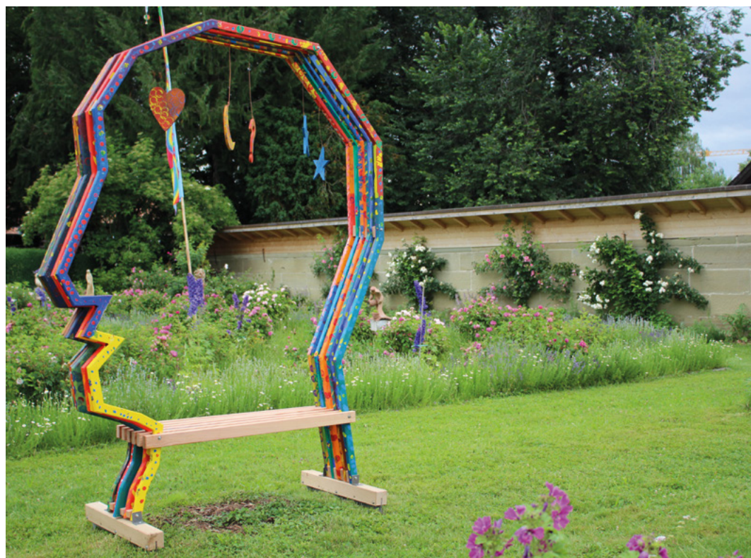
Das «Dänk-Bänkli» aus der Schreinerei.