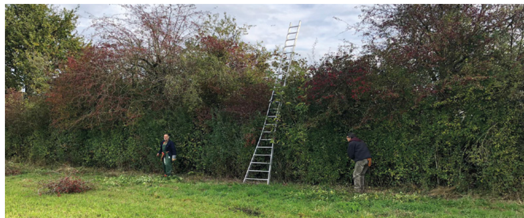
Heute steht eine wunderbare vielseitige und regional bekannte 200 Meter lange Hecke auf dem Ackerland.