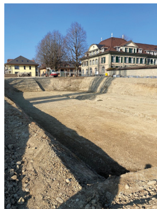
Baugrund für das neue Odilienhaus.

Tag für Tag geht es Schritt für Schritt weiter, und nimmt Gestalt an. Das sonnige, trockene Frühlingwetter hat die Arbeiten optimal unterstützt.